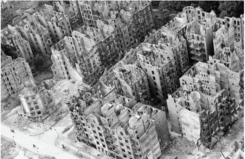
Hambourg bombardée, en 1943.