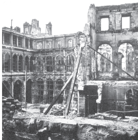
Cour intérieure de l'Hôtel de Ville de Paris après l'incendie du 24 mai 1871 par des communards.

les autres villes françaises de Caen, de Cherbourg et beaucoup d'autres, seront des cicatrices nobles desquelles on demandera au peuple français d'être fier, et il n'est pas sûr qu'elles recevront des remarques désobligeantes, comme celles adressées à la Commune, par les générations à venir d'auteurs de guides.